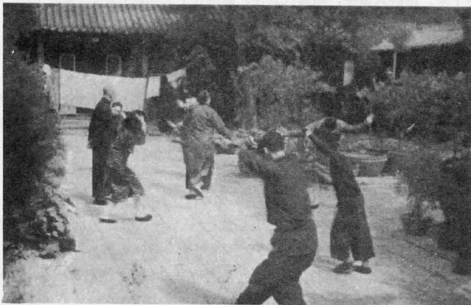
圖1 太極神教教徒表演神拳

這種印象在我觀察了孫悟子於說教完畢，率教眾至內院演習“神拳”（一種神打功夫）後，更為強化。這種由教眾跟隨教首念咒請神後操演的“神拳”活動，進行超過四十五分鐘。（圖1,2）人們由此可找到1900年“義和團”直系遺風之投影。他們（指義和團）也由相似的（唸咒）儀式開始，進入刀槍不入（的神化地步），最終使自己為政治目的而效命的。