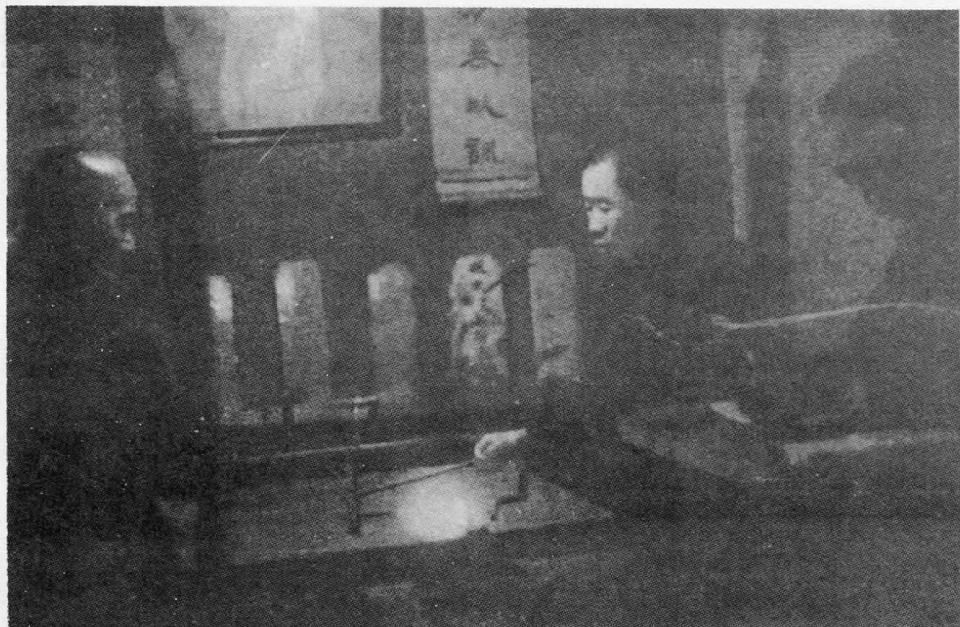
圖4 “佛教研究院”人員扶乩景象