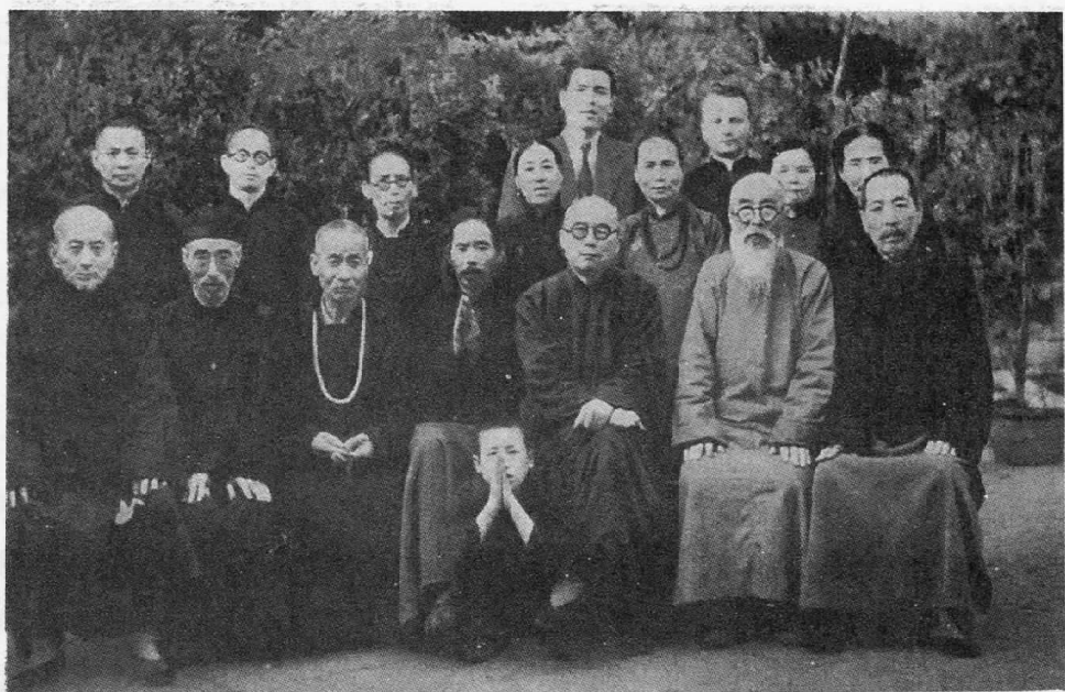
圖5 北平“宗教協進會”人員與作者合影照